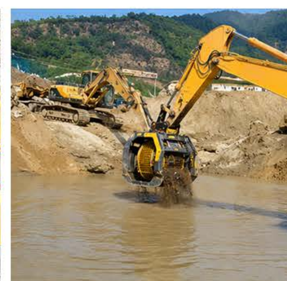
TRABALHOS EM LEITOS DE RIOS E MARGENS