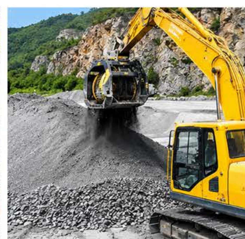
MINERAÇÃO E TÚNEIS