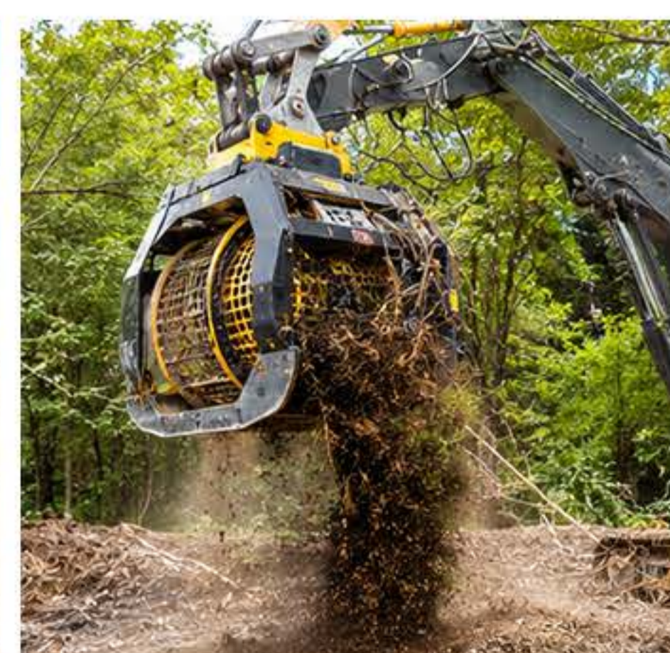
LIMPEZA E MANUTENÇÃO DE TERRENOS