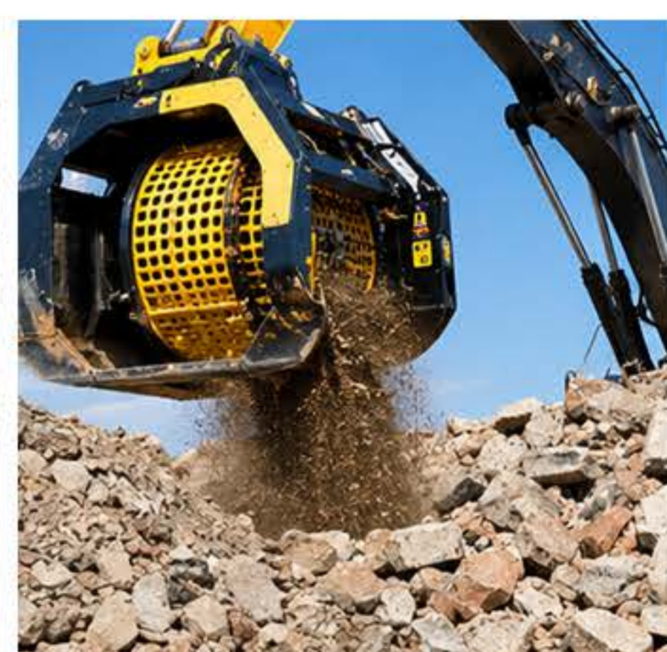
RECICLAGEM E GERENCIAMENTO DE RESÍDUOS