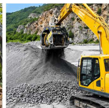
MINERÍA Y TUNELES