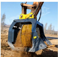
EXCAVACIÓN Y MOVIMIENTO DE TIERRA