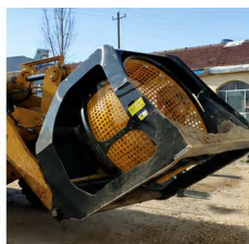
CLASIFICACIÓN DE ÁRIDOS Y GRAVA